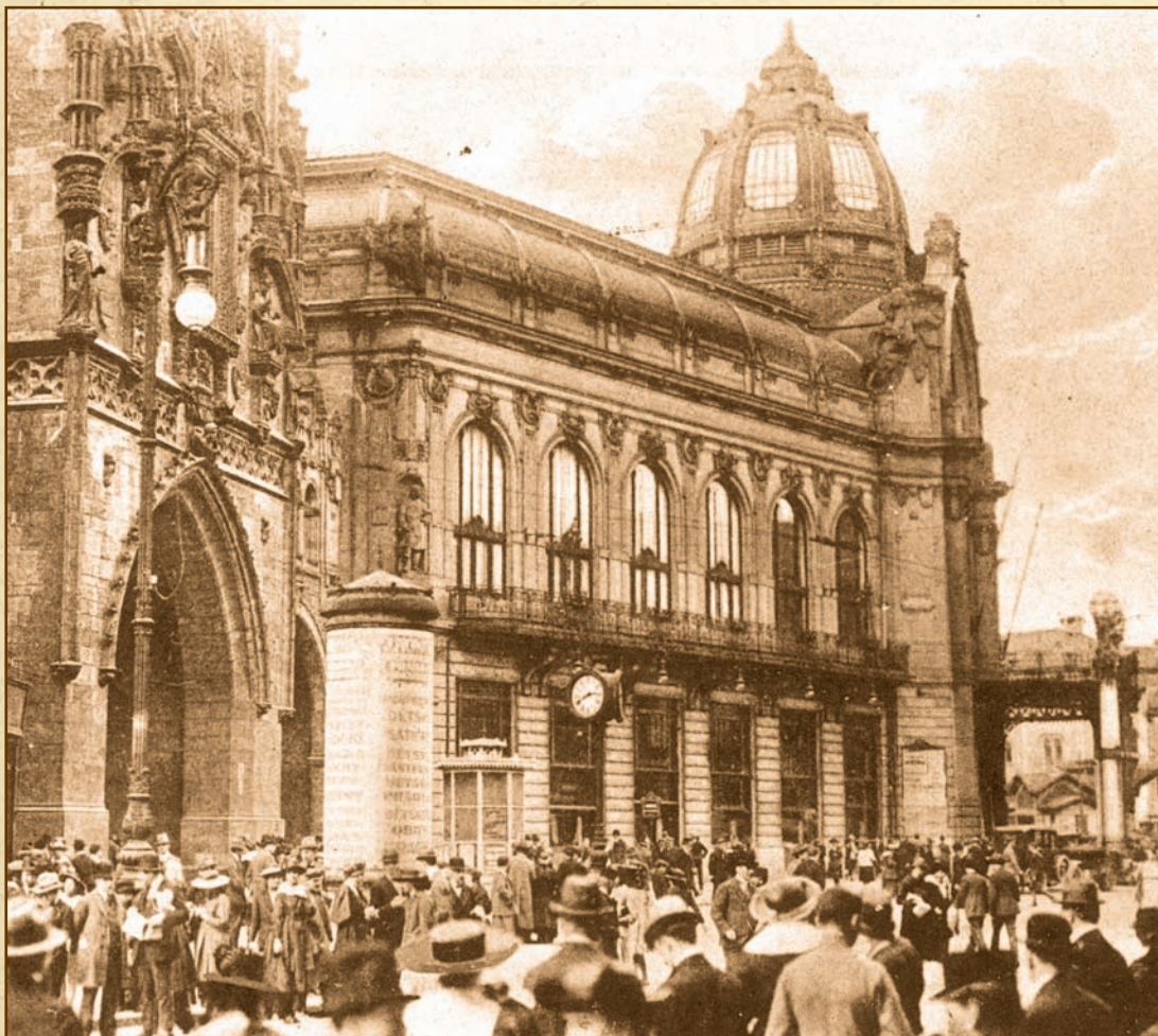
Obecní dům v Praze (1912?), kde po přednášce vulgárního materialisty F. C. Bohlena proběhla demonstrace příznivců Járy Cimrmana.