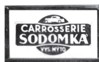
Logo firmy od 30. let 20. století