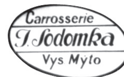
Logo firmy od poloviny 20. let 20. století