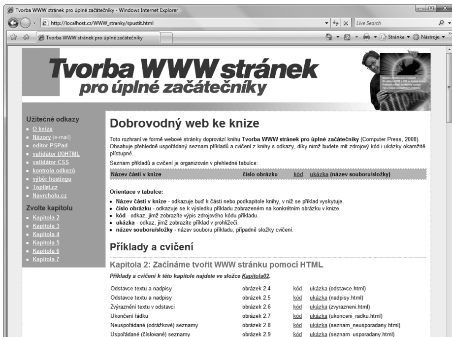
Obrázek Ú.1. Rozhraní ke cvičením