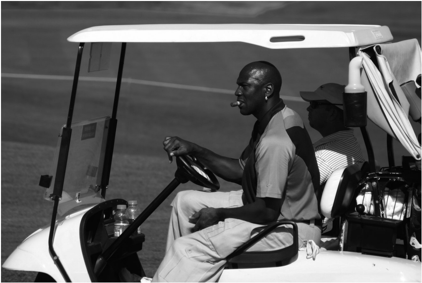
Michael Jordan na golfu v roce 2007