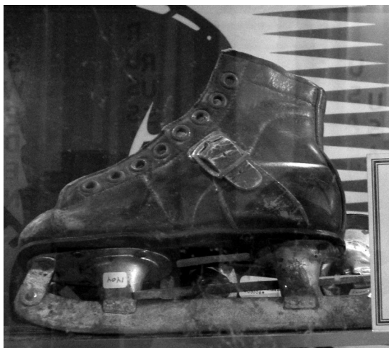
První brusle Waynea Gretzkyho z doby, kdy mu byly tři roky

V zimě jsem chtěl být jen na ledě. Vstal jsem ráno, od sedmi do půl deváté jsem bruslil, šel jsem do školy, přišel jsem domů v půl čtvrté, zůstal jsem na ledu, dokud moje máma netrvala na tom, abych se šel navečeřet, najedl jsem v bruslích a šel zpátky až do devíti. O sobotách a nedělích jsme mívali zápasy, ale večer patřil mně. Bylo to ve čtvrti jakési nepsané pravidlo, že jsem byl tam na kluzišti sám nebo s tátou.