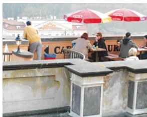
KAVÁRNA OBECNÍ DŮM