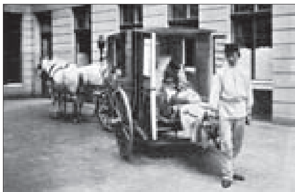
Koňmi tažená „sanitka“ z roku 1904