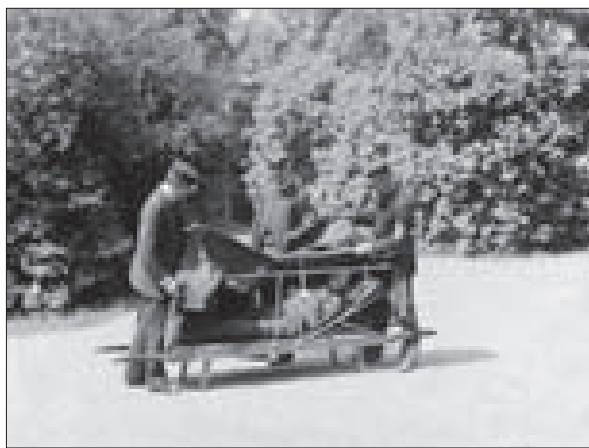
Pražští záchranáři používali různé dopravní prostředky