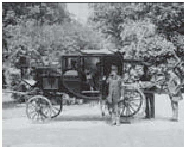
Další dopravní technika z konce 19. století