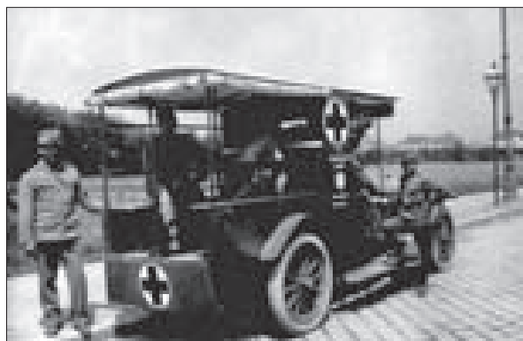
Vojenská sanitka z období první světové války