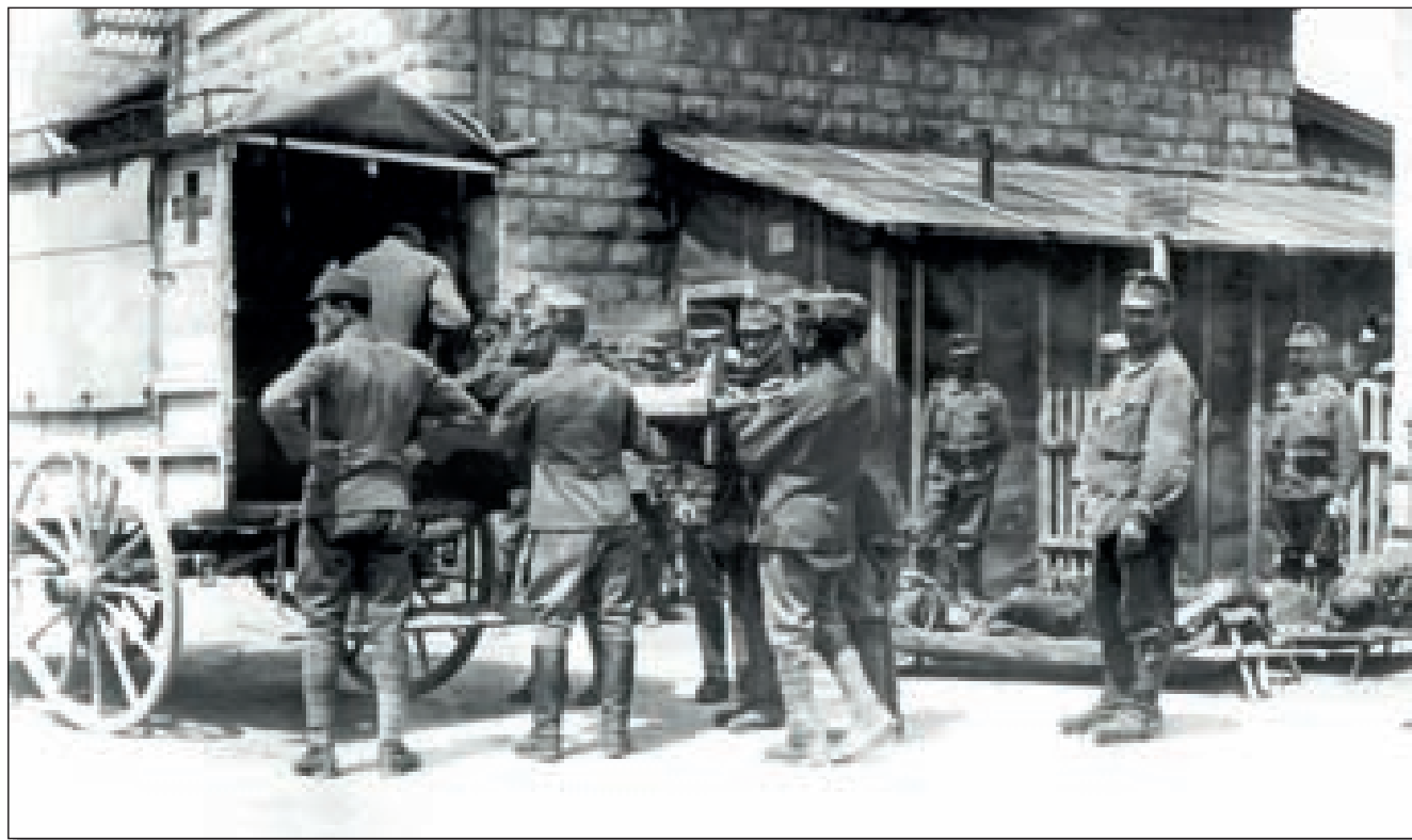
Přeprava raněných v první světové válce

Záchranná stanice se později přestěhovala do Spálené ulice, potom do Havlíčkovy ulice a od roku 1911 sídlila v budově staré mincovny na Staroměstském náměstí. Po roce 1945 se po krátkém působení v Růžové ulici na dlouhé období usadila v ulici Dukelských hrdinů v Praze 7. Od poloviny 90. let sídlí Zdravotnická záchranná služba hlavního města Prahy – územní středisko záchranné služby – v Korunní ulici na Vinohradech.