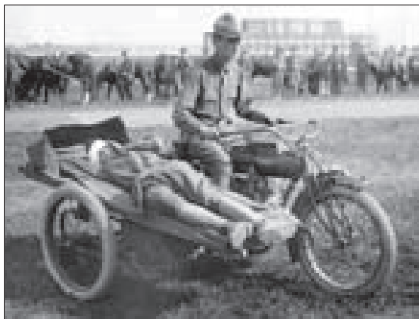
Na převoz nemocných sloužily i motocykly s postranním vozíkem. Podobný stroj používali v Praze pro odvoz opilců.