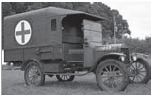
Po roce 1918 měli v Praze také tři sanitní automobily Ford T, podobné tomuto vozidlu britské armády