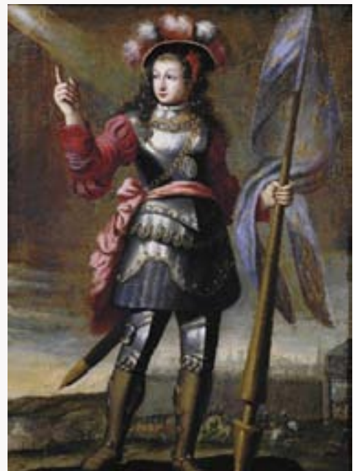
PORTRÉT JANY Z ARKU POCHÁZEJÍCÍ ZE 17. STOLETÍ.

Po přerušení obležení (viz str. 201–207) Jana pokračovala v tažení proti Angličanům rozlíceným dopisy, jež jim posílala („Byla jsem poslána Bohem, králem nebes, abych vás vypudila z celé Francie.“), a také výrazným vlivem, který měla na francouzskou armádu. V květnu 1430 byla ale u Compiègne zajata a postavena před soud. Následně byla shledána vinnou z kacířství a z nošení mužských šatů („věci odporné a rouhačské vůči Bohu“) a v roce 1431 upálena na hranici postavené na tržišti ve městě Rouenu. Pro následující generace Francouzů však zůstala symbolem očistěné a sjednocené Francie a v roce 1920 byla katolicou církví prohlášena za svatou.