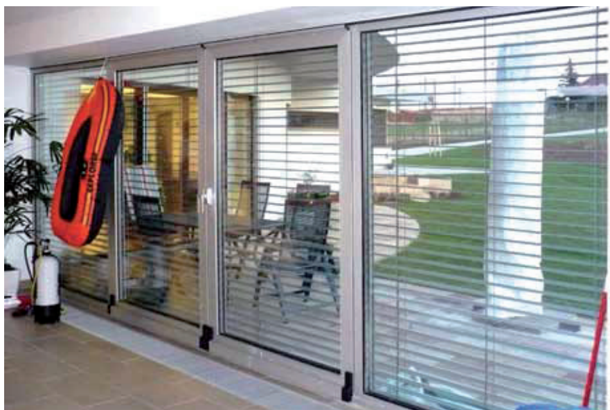
118 Prosklená stěna bazénu s možností letního otvírání do zahrady