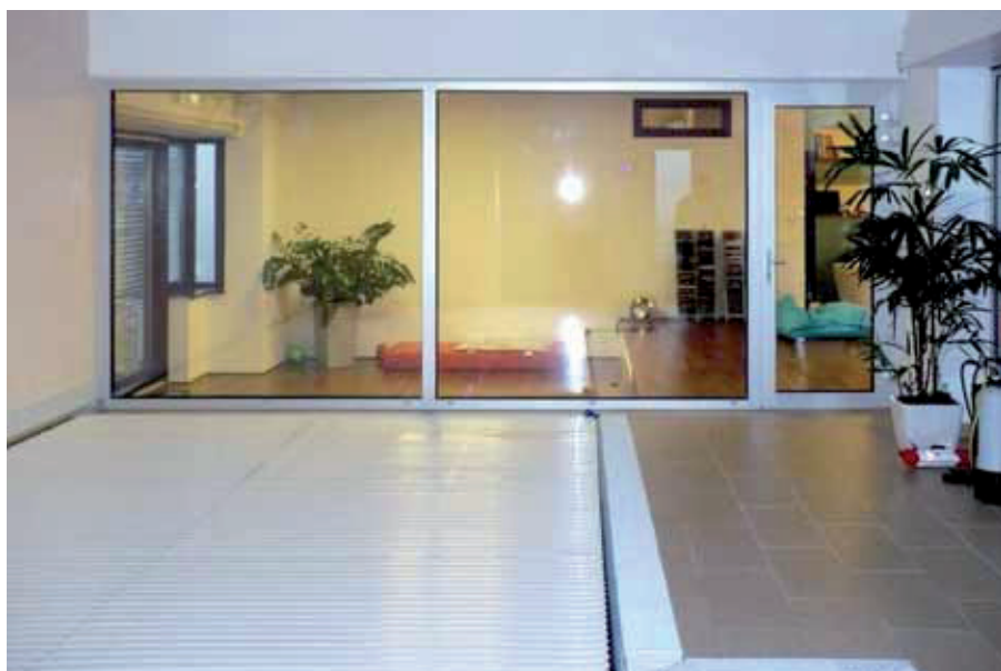
119 Zakrývání hladiny lamelovým krytem