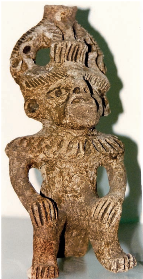
Také na severu Mexika bylo nalezeno několik sošek králů s šesti prsty .

již nad obočím a výrazně dělil čelo na dvě poloviny. Obdobný rasový znak nacházíme jen na mayských skulpturách, jinde na naší planetě se nevyskytuje.