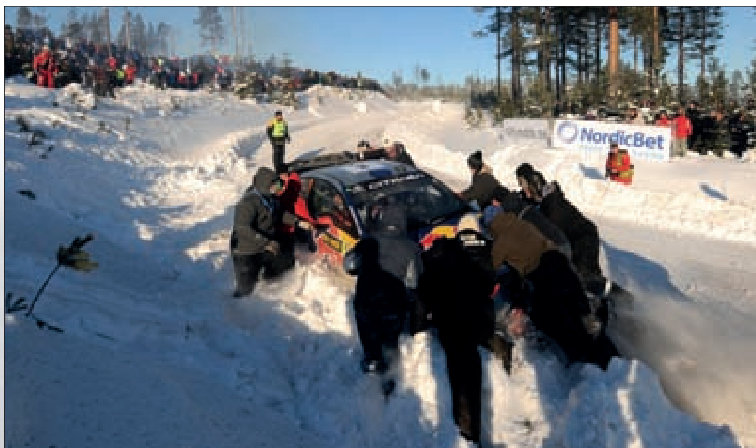
Jezdec Citroën Junior Teamu ale velmi brzy poznal, že přechod mezi soutěžáky nebude procházkou růžovou zahradou a nakonec byl klasifikován až na konci třetí desítky