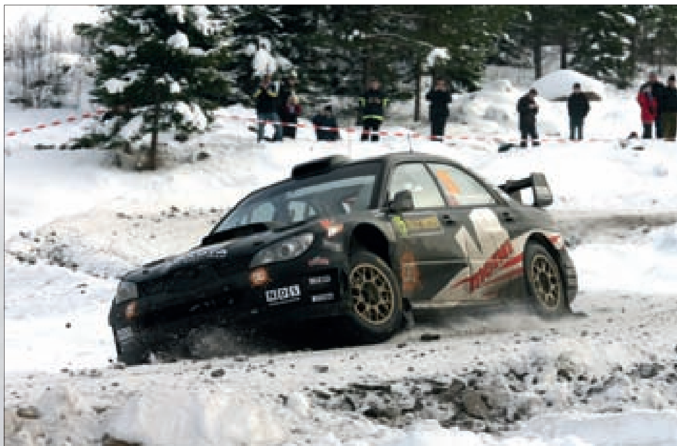
Jediným vozem Subaru Impreza WRC, který promlouval na čelní místa, byl s Madsem Őstbergem za volantem. Nor dal pro Švédskou rally přednost starší specifikaci S12B.