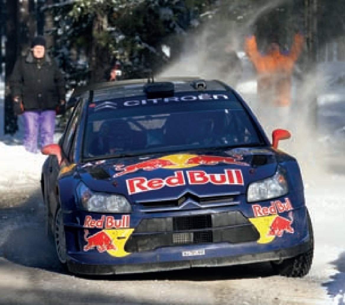
Bývalý mistr světa Formule 1 Kimi Räikkönen byl velkým tahákem úvodního závodu šampionátu...