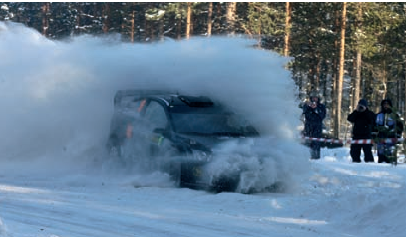
Bývalý tovární jezdec Fordu a několikanásobný vítěz Švédské rally Marcus Grönholm byl zpět, ale i kvůli problémům s motorem v úvodní etapě na absolutní špičku nestačil