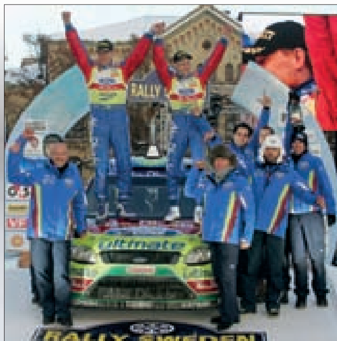
Mikko Hirvonen byl v úvodních měsících roku na vítězné vlně